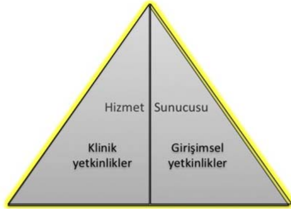
Şekil 2- TUKMOS yedinci temel yetkinlik alanı: Hizmet Sunucusu

Girişimsel Yetkinlik: Bilgiyi, kişisel, sosyal ve/veya metodolojik becerileri tıbbi girişimler konusunda kullanabilme yeteneğidir.